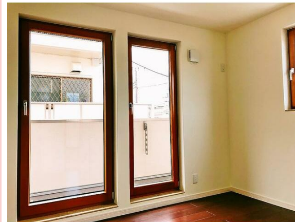
ドイツ製の木製トリプルサッシ