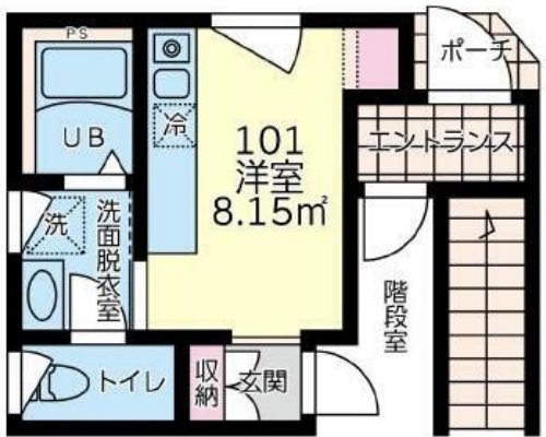
101号室・201号室・301号室(Aタイプ)